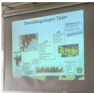
Utvecklingsstegen Tjejer, Flick – Damkronorna.