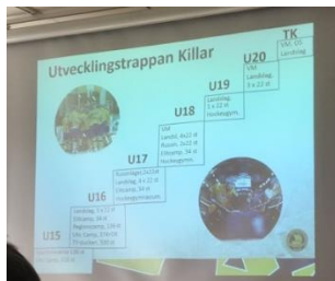
Utvecklingstrappan killar U15-U20 sedan TK.