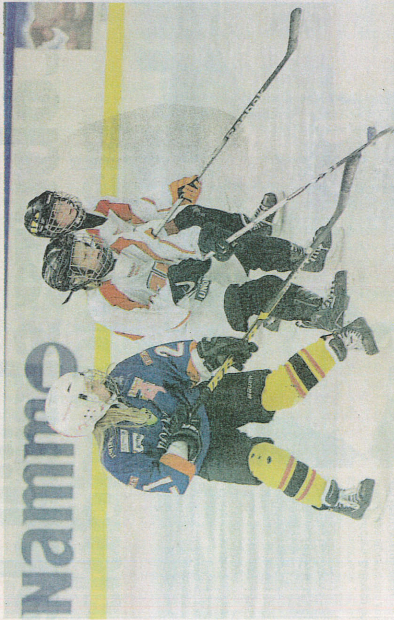
Nu gör Västergötlands ishockeyförbund en satsning för att försöka få fler tjejer att spela ishockey. Spelarna på bilden har inget direkt samband med artikeln.