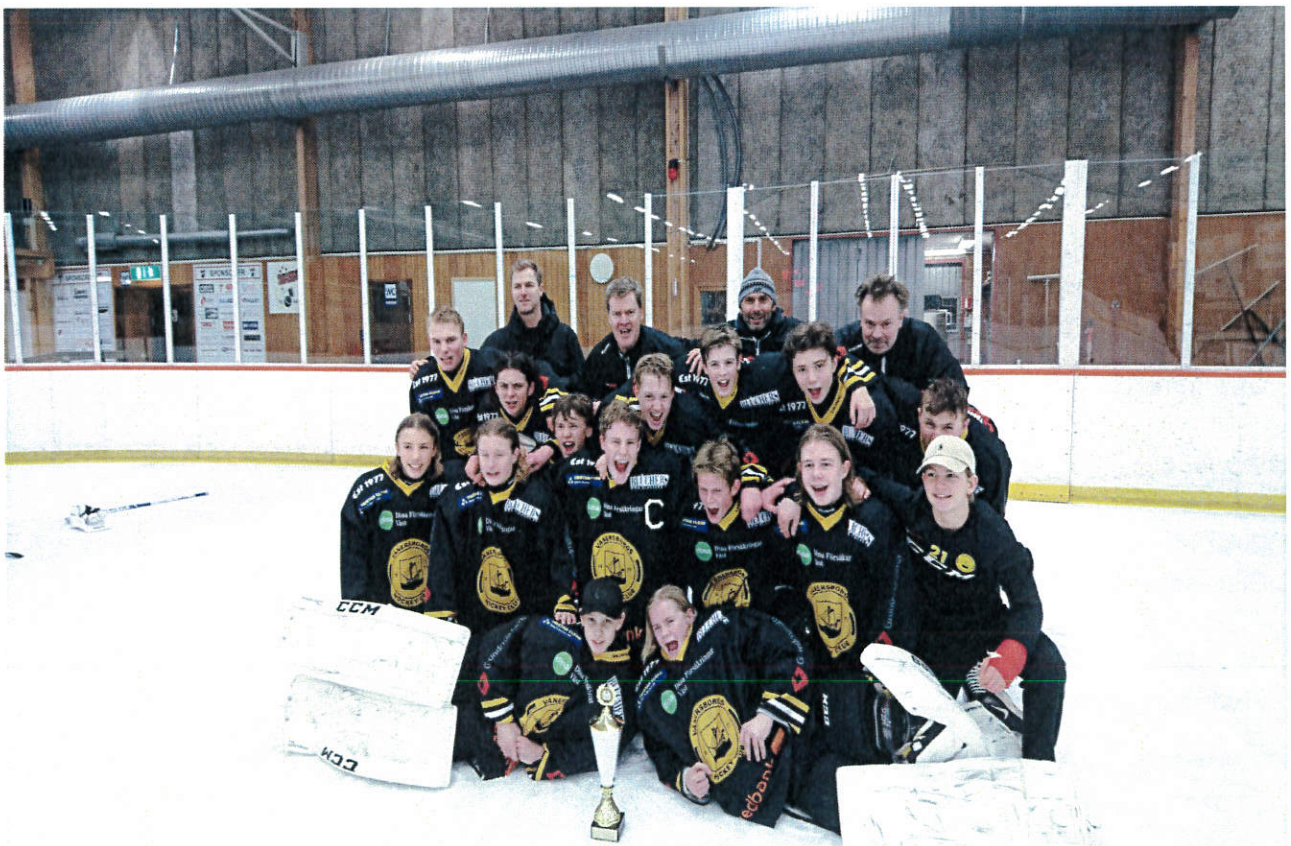
Vinnande lag U15 DM Vänersborgs HC