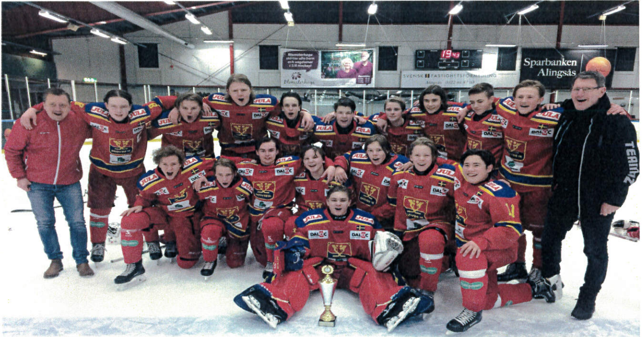
Vinnande lag U16 DM Skövde IK