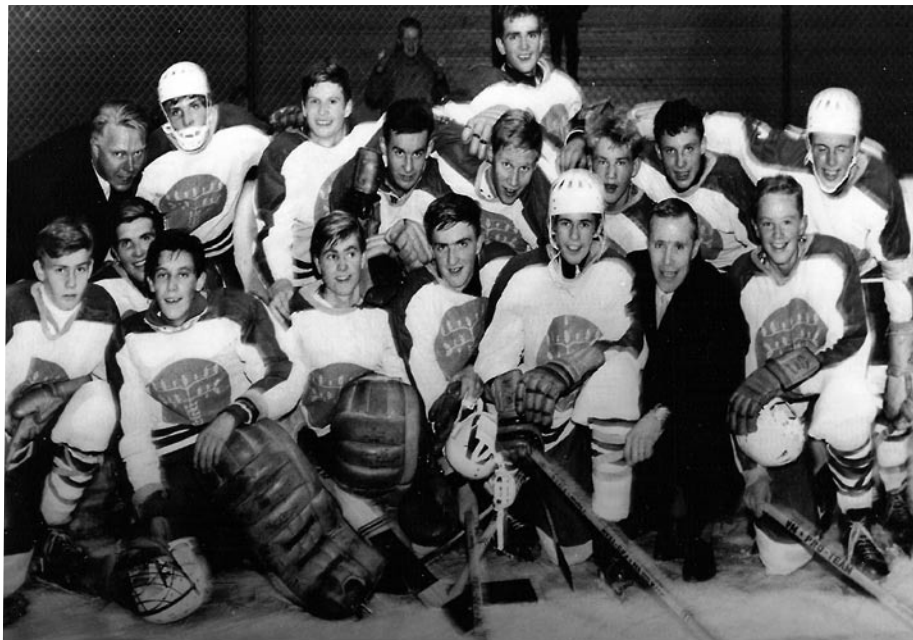
Blekinge Ishockeyförbunds TV-puck lag 1966. Laguppställning i matcher mot Gotland och Skåne i Vämöhallen 15-16 okt 1966.