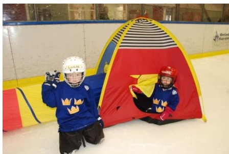
Forshaga IF med tält på isen