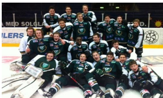
Färjestad BK - guldmedaljörer i U16 SM