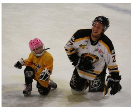
Åmåls SK med A-lagsspelare