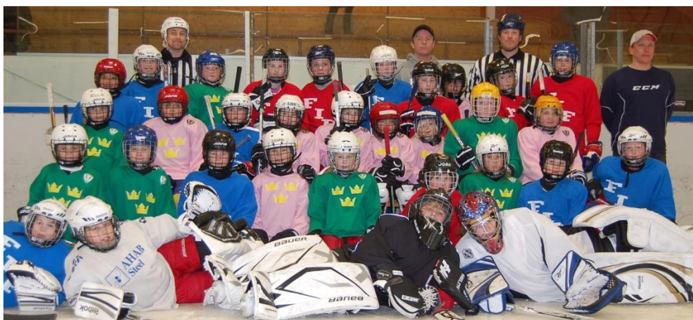
Rekryteringsprojekt för flick- och tjejhockey i Forshaga den 17 mars 2013.