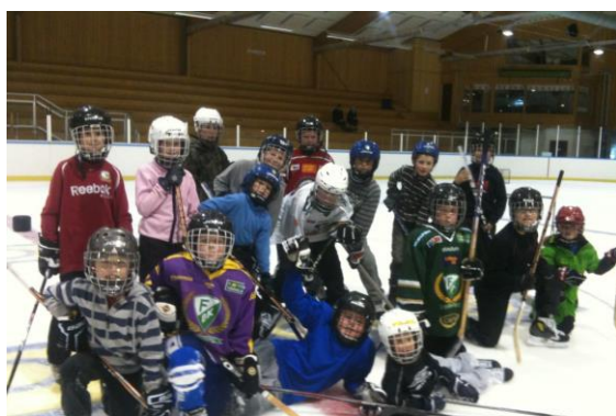
Nordmarkens HC – rekryteringsaktivitet