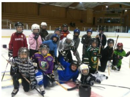
Nordmarkens HC i Charlottenbergs ishall

Bilder från olika ishallar i samband med rekryteringsaktiviteten.