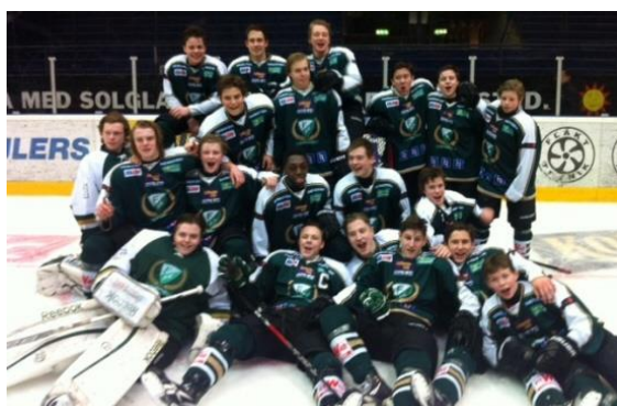
Färjestad BK – guldmedaljörer i U16 SM