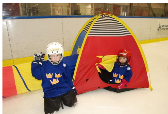
Forshaga IF - skridskoskola