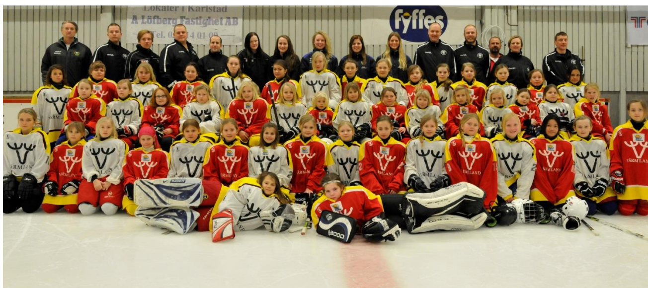
Tjejshockeydag i Karlstad 16 mars 2014 – En del av projektet "Flick- och Tjejrekrytering"

VI GÖR DET TILLSAMMANS FÖR VÄRMLÄNSK ISHOCKEY!