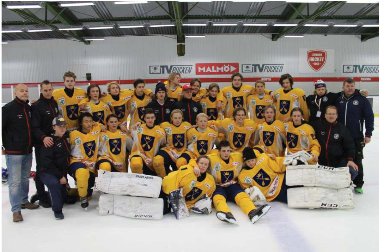
TV pucken 2016