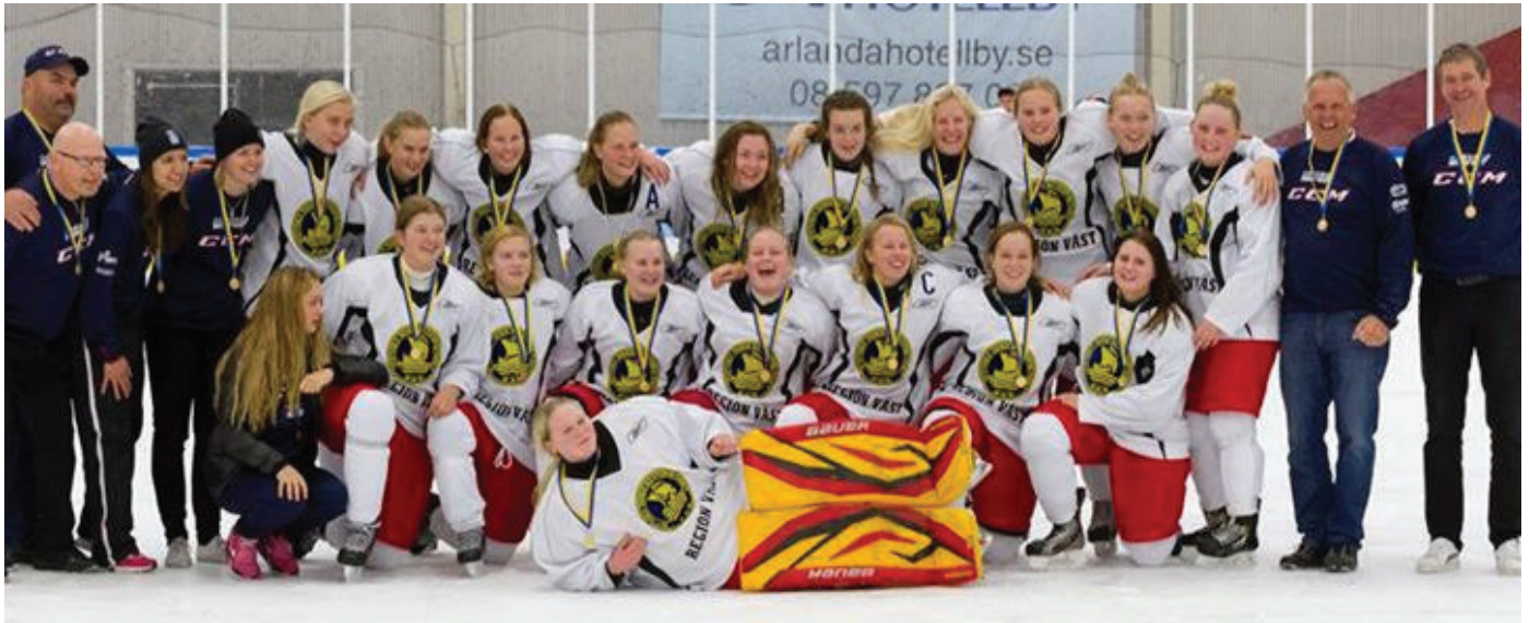
Region 18 turnering 3 – 5 oktober 2014