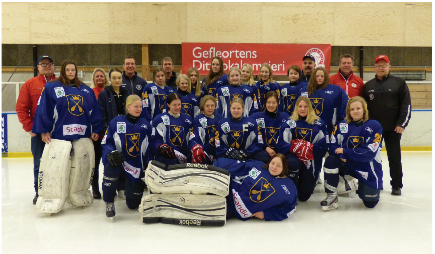
Stålbacklans Gruppspel/Region Mästare Cupen 2015