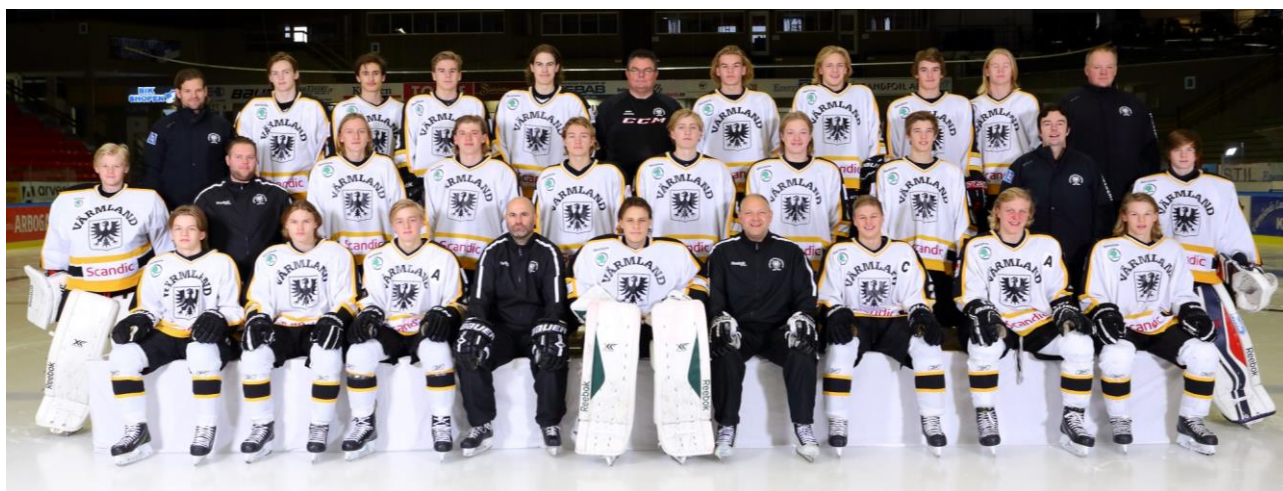
Värmland vinnare TV-pucken 2014/15