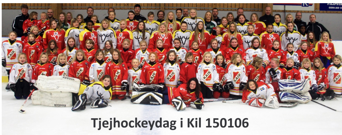
Tjejhockeydag i Kil 150106