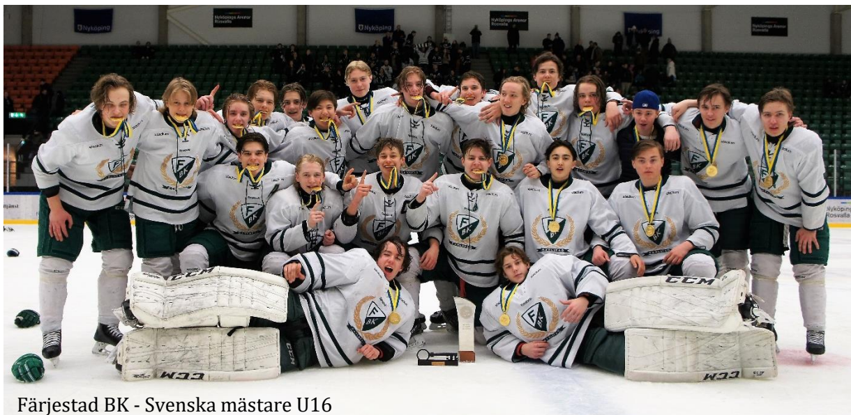
Färjestad BK - Svenska mästare U16

VI GÖR DET TILLSAMMANS FÖR VÄRMLÄNSK ISHOCKEY!