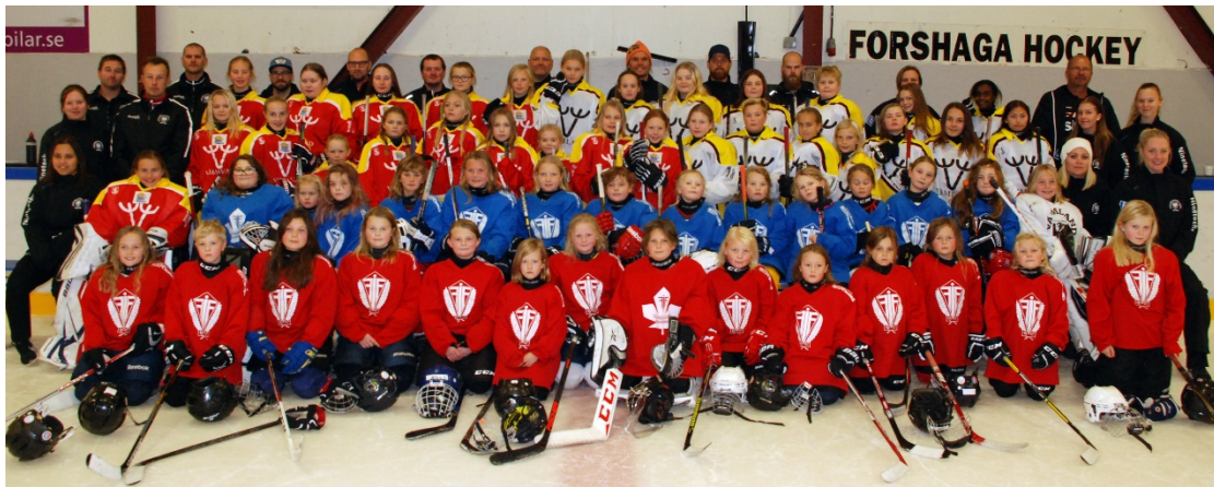
Gruppbild från tjejhockeydagen i Forshaga 171021.

Värmlands Ishockeyförbund har tillsammans med ishockeyföreningar i distriktet samt i samarbete med FBK Hockeyallians och SISU Idrottsutbildarna/Värmlands Idrottsförbund återigen genomfört "Tjejhockeyprojektet" under säsongen 17/18, för femte året i rad.