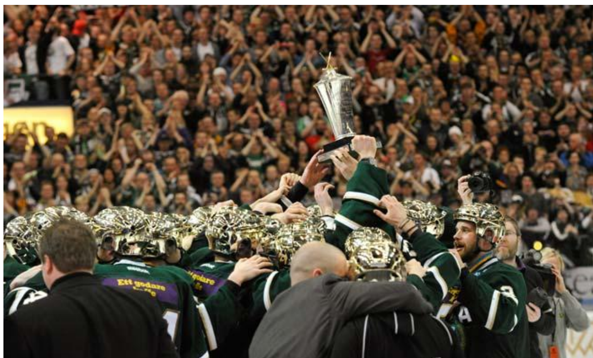
Färjestads BK - Svenska Mästare