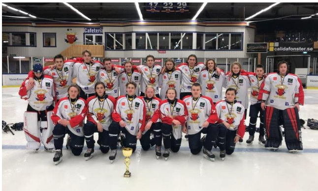
Mariestad Bois HC U16