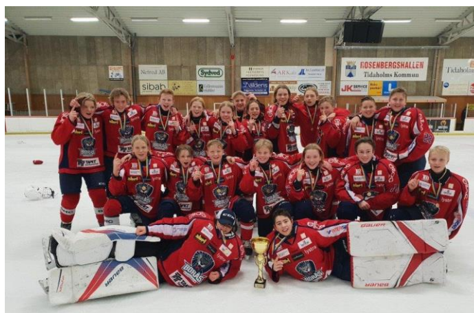
Borås HC U14

Även i år blev det väldigt många matchflyttar. En trolig anledning till detta är att flera klubbar anmäler för många lag i förhållande till disponerande av spelare och istider. Som alla vet skapar detta extra arbete/ny planering för serieadministratör, domartillsättare och gästande lag.