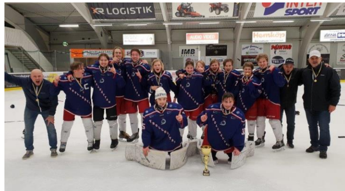
Trollhättans HC U15