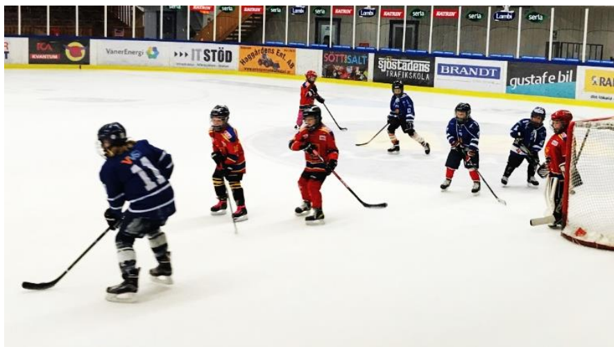
Föreningspoolspel i Mariestad