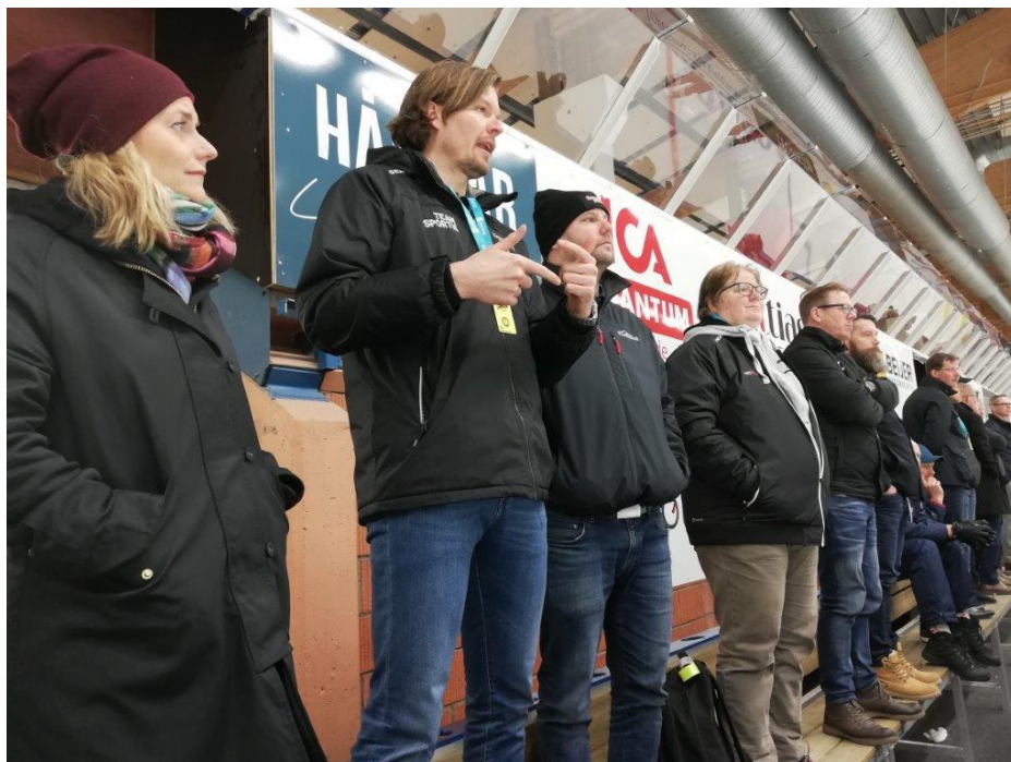
Deltagare på fortbildning/Hockeysymposiet