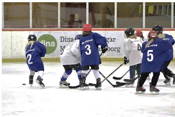
Tjejerna spelar poolspel