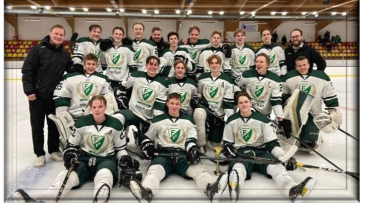
Segrare U16 DM Färjestad BK