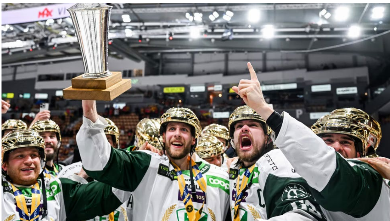
Färjestad BK Svenska Mästare 2021-2022

VI GÖR DET TILLSAMMANS FÖR VÄRMLÄNSK ISHOCKEY!