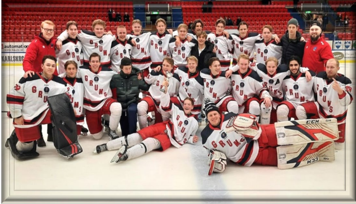
Segrare J18 DM Grums IK