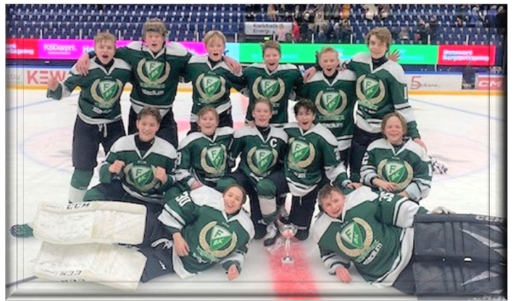
Segrare U14 DM Färjestad BK