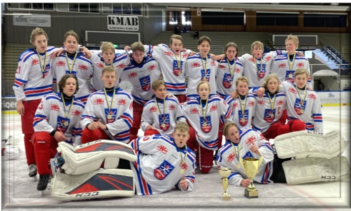
Segrare Lilla VM (U15) Hammarö HC