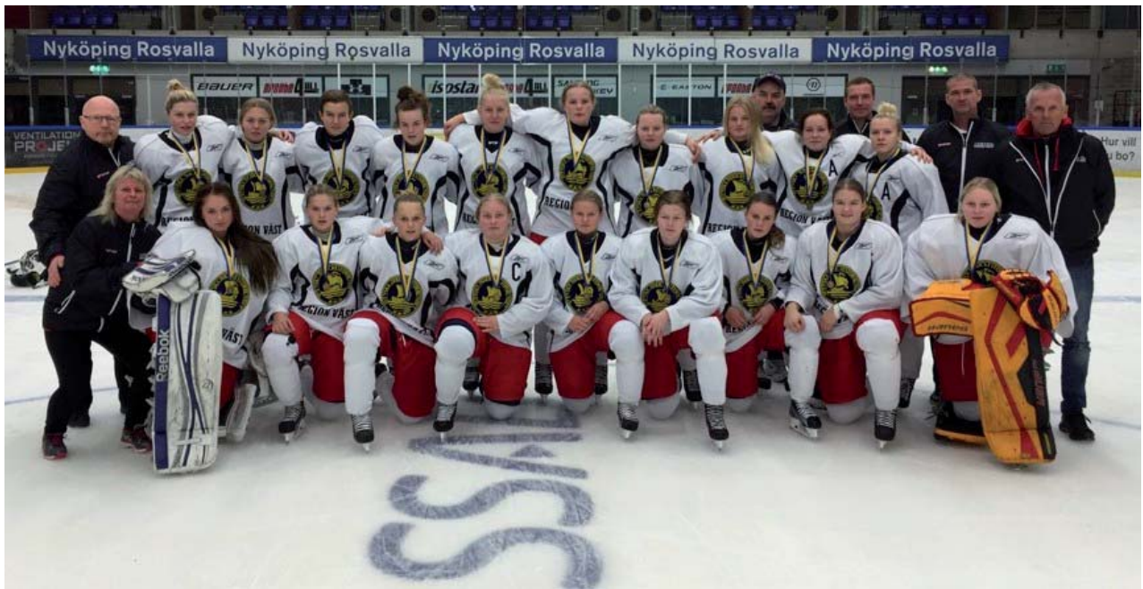
Region Västs R18-lag i Nyköping 2-4 oktober 2015.