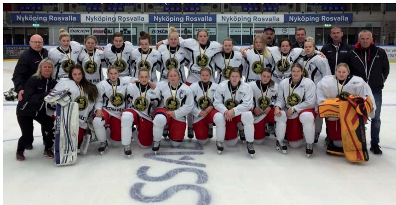
Region Västs R18-lag i Nyköping 2-4 oktober 2015.