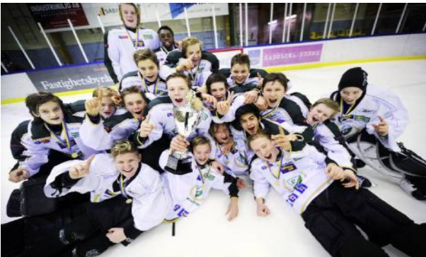
Färjestads BK - Lilla VM-mästare 2012