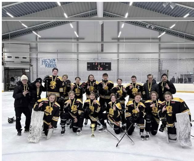
Ulricehamns IF segrande lag i U16 DM