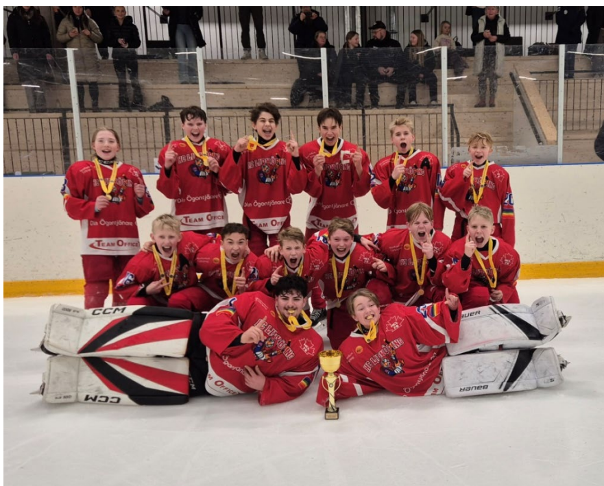
HC Lidköping Red Roosters segrande lag U14 DM

*Fotskäls HC är ej kvalificerad för total tabellen pga. representationslagets serie inte redovisar statistik.