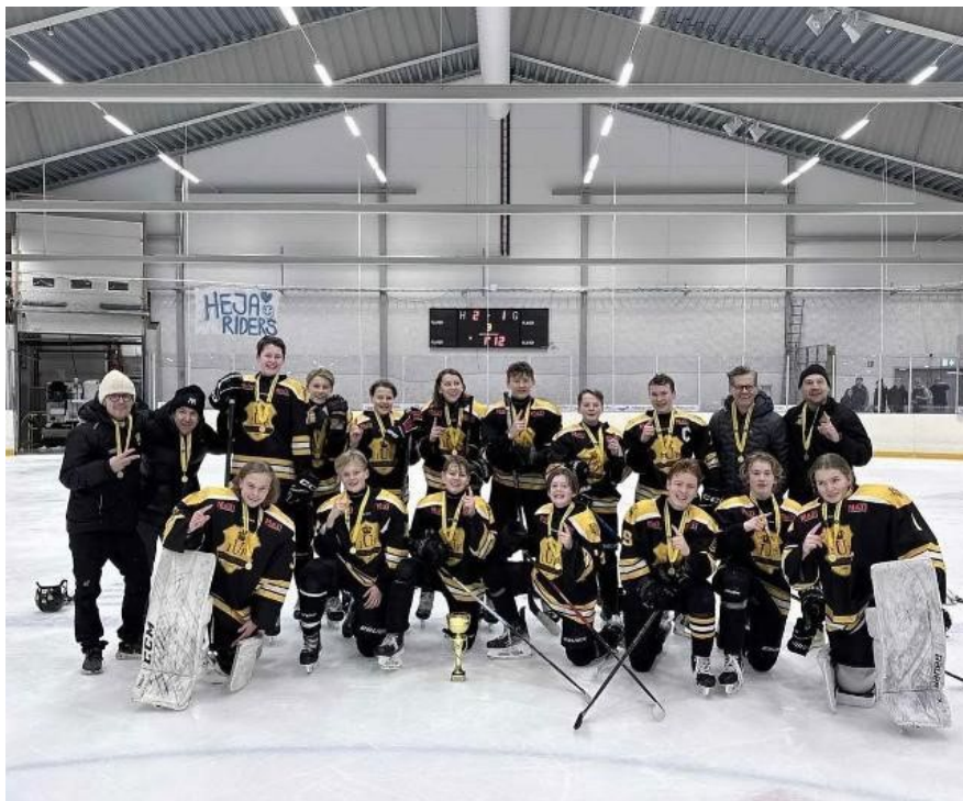
Ulricehamns IF segrande lag U15 DM